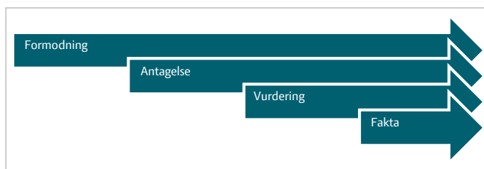
Figur 3. Kvalitativ vurdering af økonomi i HR.

Den økonomiske effekt af udgiften til HR-arbejdet vil kunne måles på lønsummen (mindre udskiftning af medarbejdere og færre sygedage) og på produktiviteten. Som ved alle andre økonomiberegninger er resultatet afhængig af de valgte forudsætninger og beregningsmetoder. Men regnestykket er ikke anderledes, når det handler om HR-indsatsen, end hvis det var investering i et "stykke teknik".